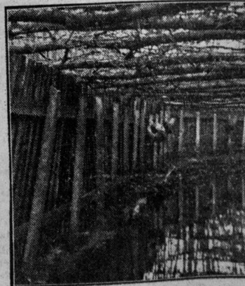
Een kijkje op een